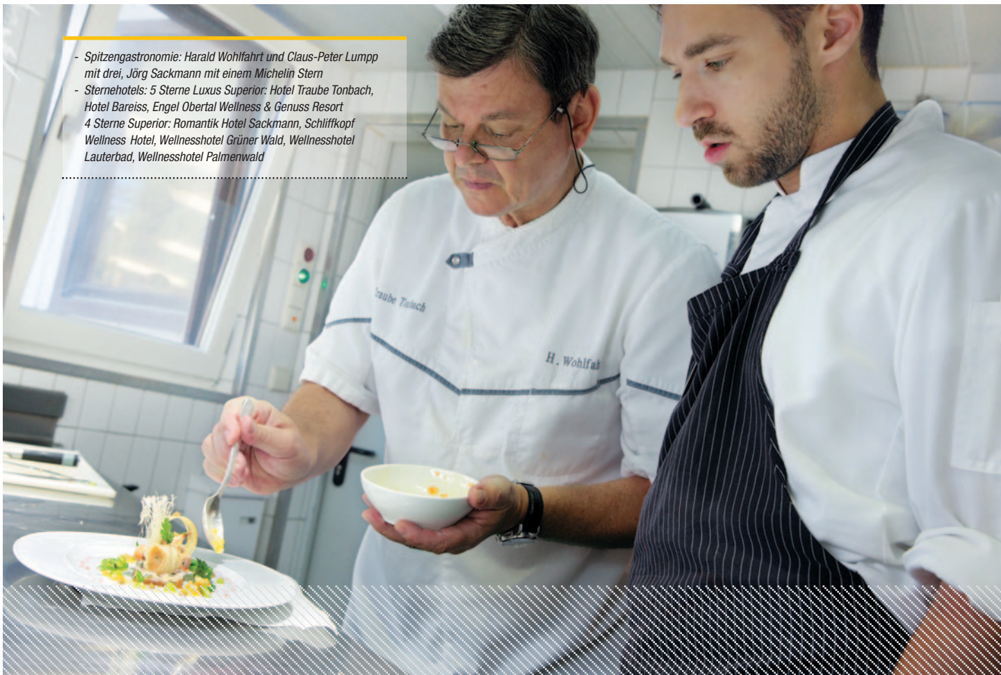
... am Herd //