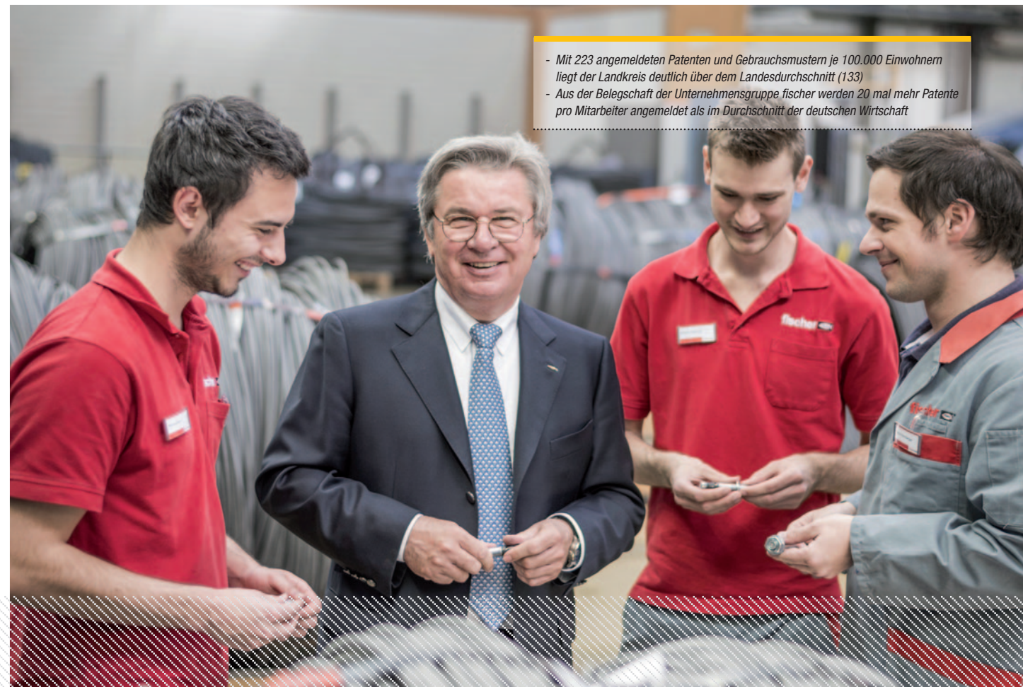
... in Unternehmen //